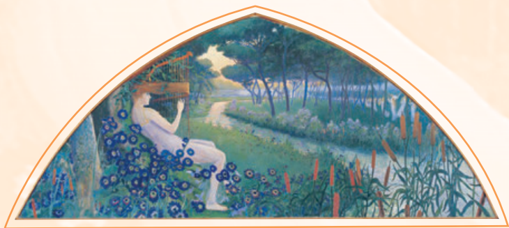
Santiago Rusiñol i Prats La Música , París, primavera de 1894

El Modernisme mirarà de representar de manera naturalista els paisatges humans de l'època, però també és resultat d'una tradició cultural. Mitjançant estudis i còpies d'obres renaixentistes que feia Rusiñol, al Museu del Cau Ferrat podem resseguir-hi un canon pictòric marcat pel gènere que, encara que pateixi modificacions al llarg dels segles, manté una sèrie de constants en la representació de les figures femenines.