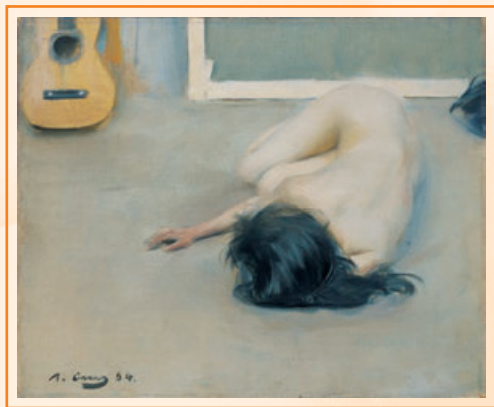
Ramon Casas i Carbó Nu amb guitarra, 1894

En el lloc oposat del model de l'«àngel de la llar», que es la de la felicitat domèstica, s'hi situa la dona desitjable, sexualitzada i sovint perversa, que és objecte de la mirada masculina. Aquests dos pols han servit per sancionar els models de comportament de les dones fins a l'actualitat.