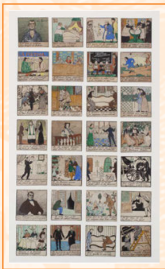
Ramon Casas i Carbó L'Auca del Senyor Esteve Auca formada per 28 vinyetes amb rodolins de Gabriel Alomar 1907

El desenvolupament del capitalisme industrial reforça la divisió de rols i treball entre els homes i les dones, entesos com a sexes complementaris. Per als homes, es considera prioritari el treball assalariat i la presència pública, i per a les dones, la cura de la família, el treball domèstic i l'esfera privada. Aquesta divisió es veu reflectida en la vida personal de Santiago Rusiñol.