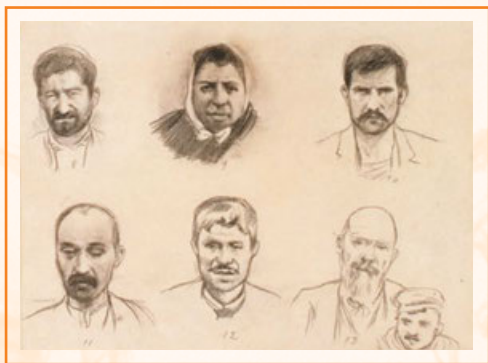
Santiago Rusiñol i Prats Retrats dels anarquistes del procés de Montjuïc Barcelona, c. 1897

Al llarg de la història, les dones han estat agents del canvi social, i el seu treball ha sostingut els entorns socials i familiars. La seva activitat política, intensa en l'època del Modernisme català, té poca presència a les obres artístiques, però es fa present en els retrats de les anarquistes del procés de Montjuïc.