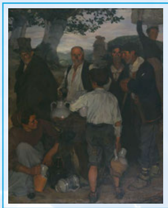
Ignacio Zuloaga Zabaleta La partició del vi, c. 1900

La història de l'art no és un relat neutre, sinó que, com tot relat històric, expressa una mirada, uns interessos i uns valors determinats dels qui han contribuït a escriure-la. Què es prioritza i què hi és absent? Mirar i pensar entorn de les obres d'art i com s'exposen ens permet reflexionar sobre els criteris i el context en què van ser realitzades o salvaguardades, i sobre com s'entendrà la nostra societat al futur.